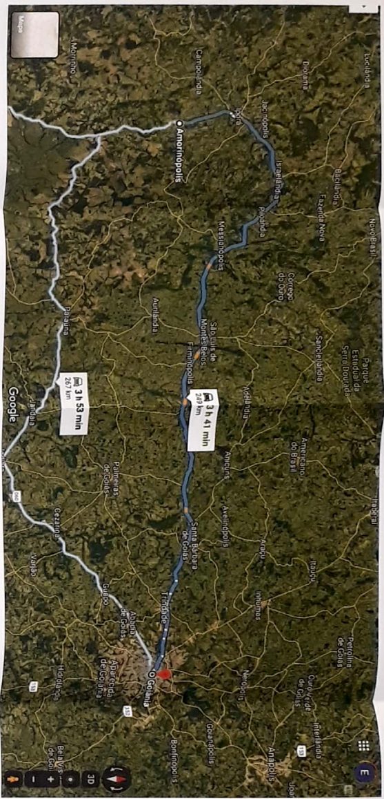
07 AMORINÓPOLIS A GOIÂNIA