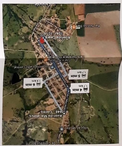
07 LOCAL DE REALIZAMENTO DO MATERIAL, ATE O LOCAL DO SERVIÇO